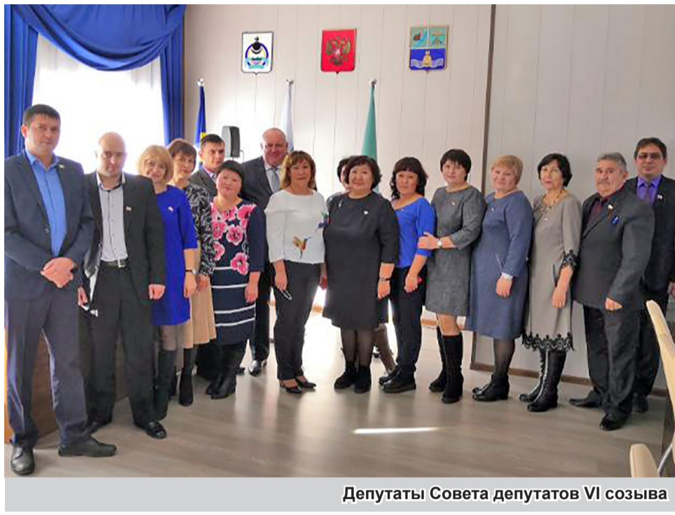
Депутаты Совета депутатов VI созыва